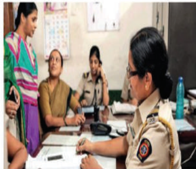
Once all the entries are in, five best submissions will be selected

The city police department is known to come up with corrective measures from time to time to bring in reforms within the force. In a similar initiative, Pune police commissioner K Venkatesham has urged each member of the police force to pen down their experiences as individuals in the department and express their views on how they feel about their work and the department. The unique programme takes into cognisance the fact that these law enforcement professionals also have a tender, creative side to them. Apart from discharging their daily duties, while some officials have a writing streak, taking to either prose or poetry, some among them are melodious crooners. However, due to lack of time and right platforms, most of them fail to showcase their creative talents before the masses. This prompted Venkatesham to