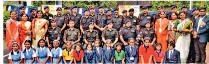
सज्जय डेपो एएससी हेड क्वार्टर दक्षिण महाराष्ट्र सब एरिया या ठिकाणी ‘लोकमत’ कॅम्पस क्लब व सखी मंच सभासदांनी जवानांसोबत रक्षाबंधन साजरे केले.