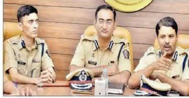
पत्रकार परिषदेत माहिती देताना पोलिस अधिकारी.