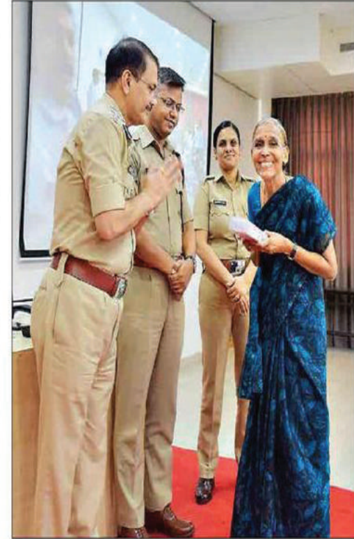
GOOD GESTURE: Additional Commissioner of Police (crime) Ashok Morale (L) greeting a woman who got back her stolen valuables on Saturday.

The returned valuables included gold, silver ornaments, cash, vehicle, etc. Additional Commissioner of Police (Crime) Ashok Morale said, "These steps will assist in preventing burglaries and other crimes. We have intensified patrolling as well as checking of criminals on record." Most of the cases in which valuables were returned were from Zone 4 (24) cases and Zone 1 (18) cases. Among the police stations, most cases (9) were from Samarth police station.