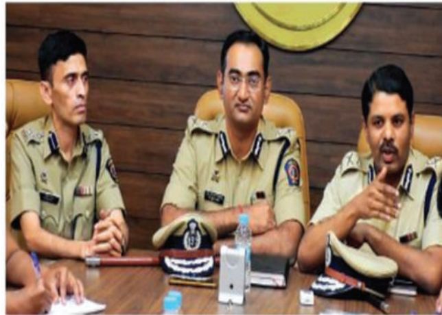
Police heads of various districts held a crime coordination border conference

A head of the upcoming Ganeshotsav and with the state Assembly elections inching closer, police from all the districts of western Maharashtra have come together to tighten the noose on criminals and check antisocial activities in the districts. Police have prepared a road map for exchanging information on criminals, coordinating between control rooms, combining operations. The police heads of various districts came together for an inter-district crime coordination border conference in Pune on Wednesday.