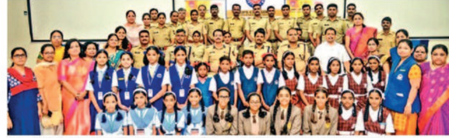
पुणे शहर पोलीस आयुक्त कार्यालयात ‘लोकमत’ कॅम्पस क्लब व सखी मंच सभासदांनी पोलीस अधिकाऱ्यांसोबत रक्षाबंधन साजरे केले.

नुकताच पोलीस व्यापाऱ्यांच्या मदतीने नेहमी शहरातील नागरिकांची बंदळ असलेला लक्ष्मी रोड सी वॉच प्रकल्पाच्या नजरेत आणला आहे. यामुळे संपूर्ण लक्ष्मी रोड सीसीटीव्हीच्या कक्षेत येणार आहे. यामुळे लक्ष्मी रस्त्यावरील गुन्हेगारीला प्रतिबंध करणे तसेच घडलेल्या घटनांवर लक्ष ठेवणे आता अधिक सोपे जाणार आहे.