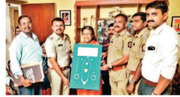
पोलिसांनी ऐवज संबंधित महिलेच्या घरी जाऊन सुपूर्त केला.

सांगितले. मोबाईलच्या कव्हरमध्ये नोटा असल्याचे सांगितले. पीएमटी बसने कोढव्याला जात असताना मोबाईल खाली पडला होता. उद्या येऊन मोबाईल घेतो असे सांगितले. दुसऱ्या दिवशी खात्री पटल्यानंतर नागमंत्री याला त्याचा हरवलेला दहा हजार रुपये किमतीचा मोबाईल परत करण्यात आला. नागमंत्री हा विगरी काम करीत आहे.