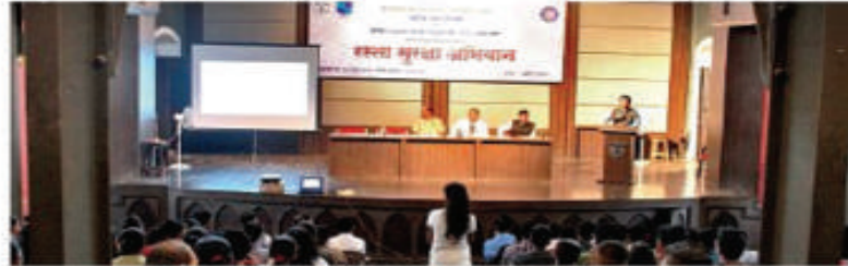
Traffic department has conducted awareness programmes in colleges

"We, therefore, have initiated a joint venture with the deputy director