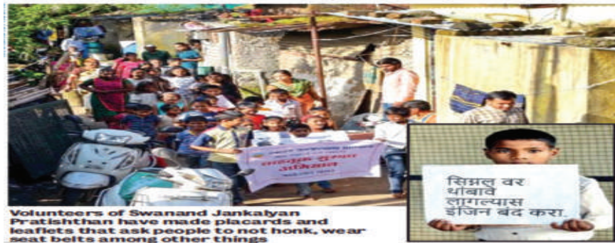
Volunteers of Swanand Jankalyan Pratishthan have made placards and leaflets that ask people to not honk, wear seat belts among other things