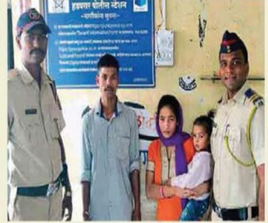
हडपसर पोलिस ठाणे : पोलिसांच्या सतर्कतेमुळे भेकराईनगर येथून भरकटलेल्या दोन वर्षांच्या चिमुकलीला तिचे आई-वडील भेटले.