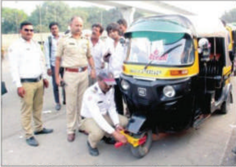
पुणे : स्वारगेट येथील जेथे चौकट बेशिस्तपणे वागणाऱ्या रिक्षाचालकांवर वाहतूक पोलिसांनी कारवाईचा बडगा उगारला आहे. त्यामुळे चालकांचे धाबे दणाणले आहेत.