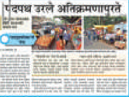
पेटपध उरले अतिक्रमणापरते