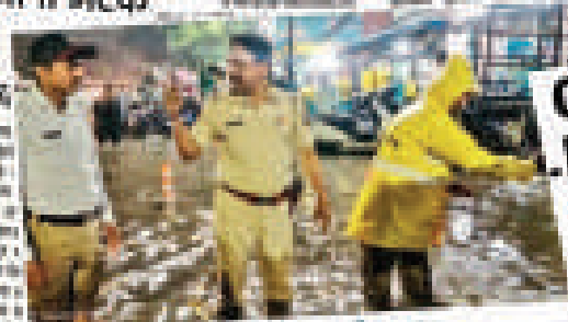
पुलिसांकडून पावसाचा पाई रकबाजरी प्रकल्प...

विद्यालयाचे धोतले वाहून घेण्याचे विद्यालयाचे धोतले वाहून घेण्याचे