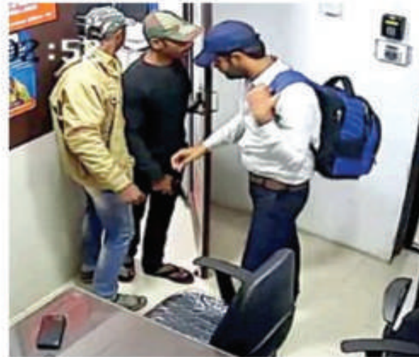
A CCTV footage of the crime taking place