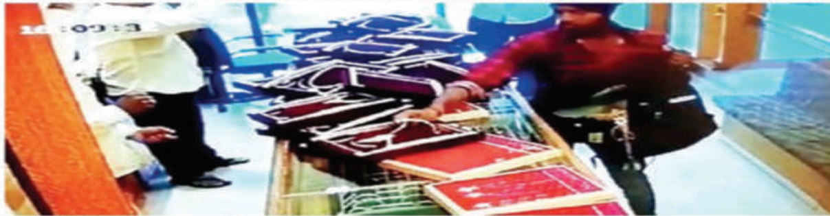
The heist had been caught on CCTV camera at the shop on November 24

Crime branch picks up duo, including dismissed constable, for looting Kothrud showroom of Pethe Jewellers at gunpoint, stealing goods worth ₹10 lakh