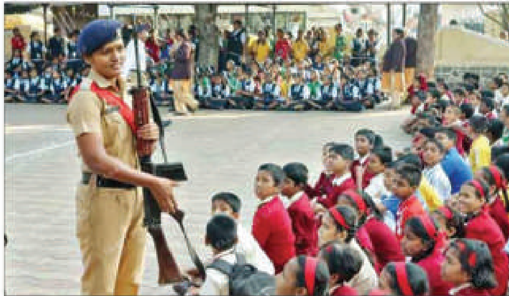
HOW IT WORKS? A woman constable talks about weapons with students on Friday.

Senior police officers led by zonal Deputy Commissioners of Police (DCP) were present along with teachers of the schools. The students interacted with the police personnel and also took selfies with them. They were informed about the functioning of the police department. Officials said the initiative will help them wean students away from crime and also