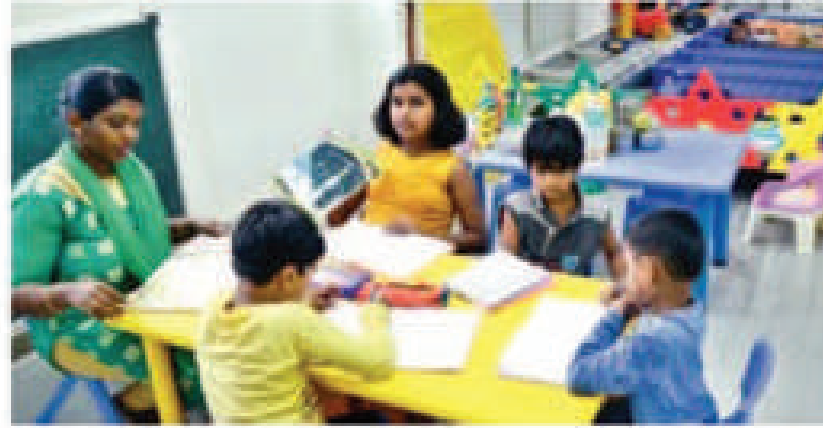
शिवाजीनगर येथील डे केअर सेंटर.

पुणे : ड्यूटीच्या वेळा अनियमित शिवाय त्या कधी कधी १२ तासांहून अधिक काळ, सणाला चंदोचस्त असतो तो वेगळ्याच अशा वेळी इतर पाळणाघरमध्ये सोय होत नसल्याने अनेक पोलीस कर्मचाऱ्यांचे ड्यूटी करीत असताना सर्व लक्ष आपल्या लहानग्यांकडे लागले असते. पण आता त्यांची ही चिंता दूर झाली आहे. आपल्या लहानग्यांची चिंता न करता पोलीस कर्मचारी आपली ड्यूटी बजावू शकणार आहे. कारण शहर पोलीस दलाच्यावतीने पोलीस कर्मचाऱ्यांच्या लहान मुलांसाठी डे केअर सेंटर सुरु करण्यात आले आहे. अत्याधुनिक सोयी-सुविधा असलेले हे डे केअर सेंटर शिवाजीनगर येथील पोलीस मुख्यालय व समर्थ पोलीस लाईन अशा दोन ठिकाणी हे डे केअर सेंटर सुरु केले आहे.