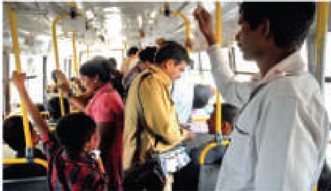
The cops have been keeping a vigil since last week