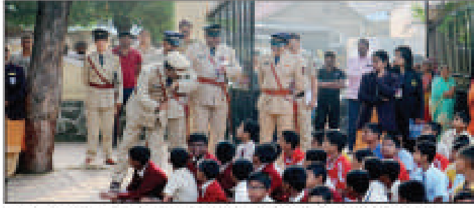
Police personnel interact with students of St Anthony's School