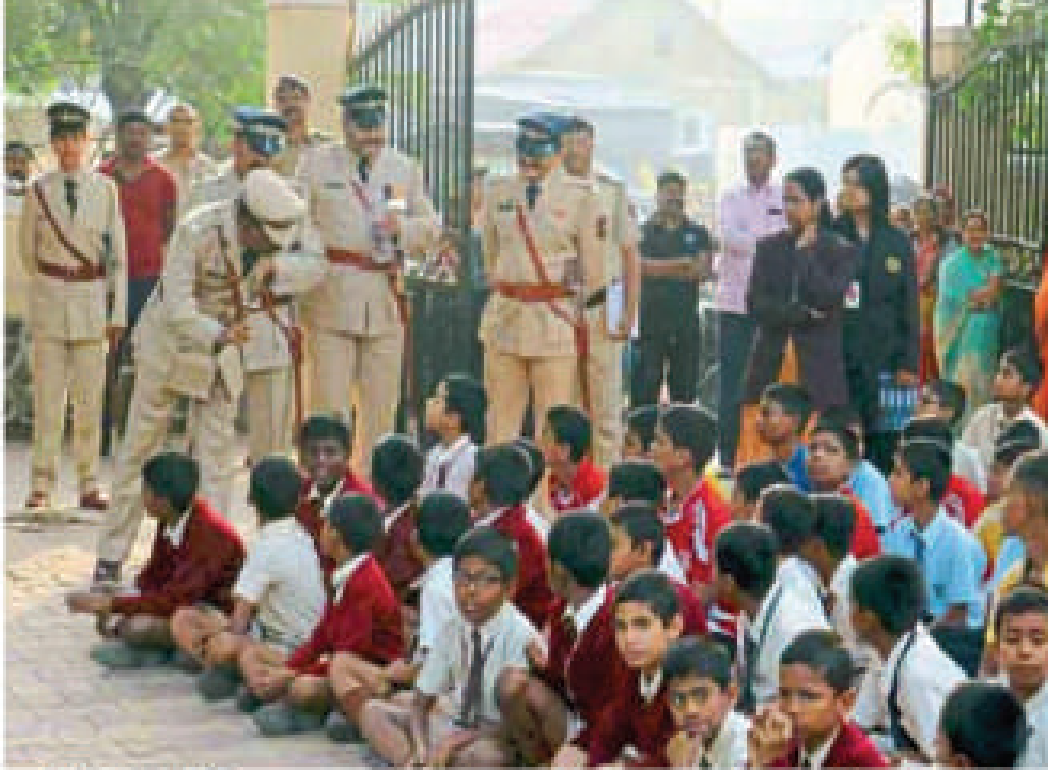
छाडकी : सेंट अन्धोनी हायस्कूल शालेच्या मैदानात झालेल्या पोलिसांमध्ये पोलीसांनी विद्यार्थ्यांना 'पॅरिचल', 'तेज चल', मॅल्युटचे प्रकार, रायफल बाबिथची माहिती दिली.