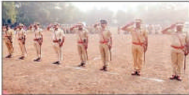
येवज्या येथील मोझे प्रशालेत संचलनाथेची मलायी देवना पोलिस.