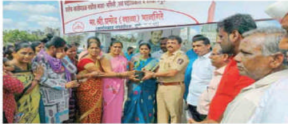
हडपसर । प्रभाग २६ मध्ये सीसीटीव्ही कॅमेऱ्यांचे लोकार्पण करताना मान्यवर.