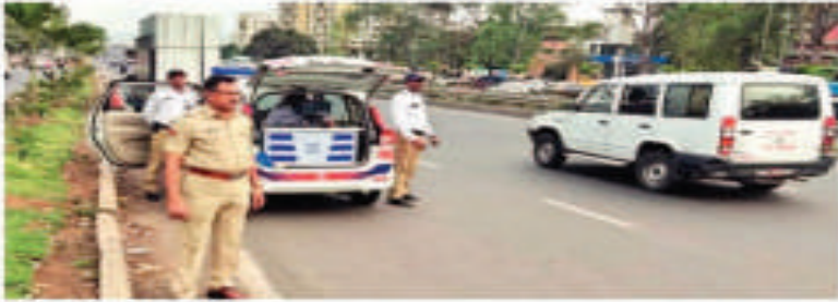
वाहतूकपलम वाहनचालकांकर अडवळणुकेर करीनटुने वेगवेगळीं कारवायें करतना पोलीस निरींकर विवेकरंत वळखी, करींवाची लींकर अडिं, प्रलींकर लकडकर व निरिंकर लींकर.