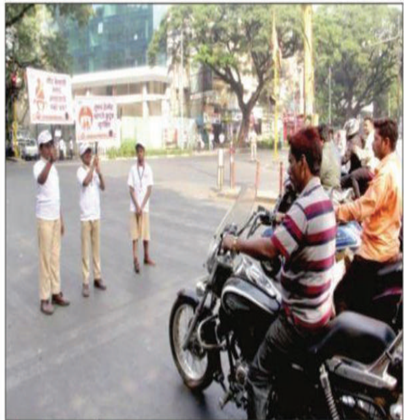
पुणे : विद्यावर्धनी इंग्लिश मीडियम स्कूलच्या विद्यार्थ्यांनी झाशी राणी चौकात वाहनचालकांना वाहतुकीच्या नियमांचे पालन करण्यासाठी जनजागृती केली.