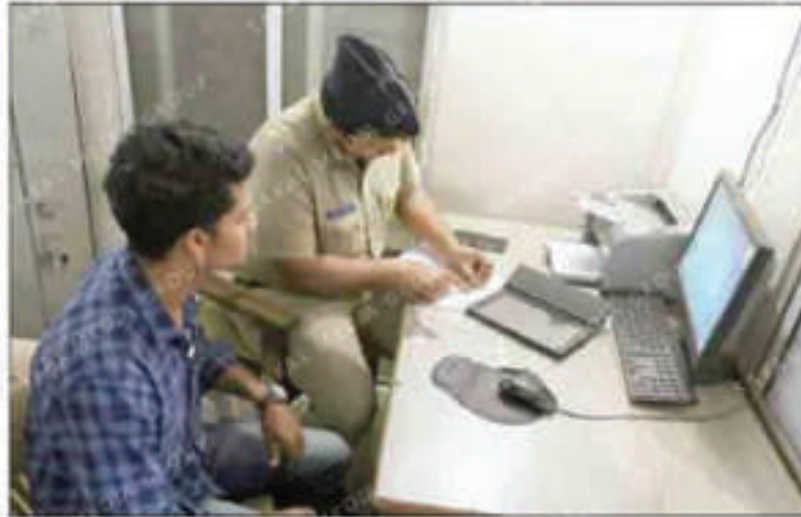
WORK MODE: A policeman working at passport branch of Shivajinagar police station on Wednesday.

Commissioner of Police Dr K Venkatesham told Sakal Times, "Things like process engineering, technology, training of the staff members