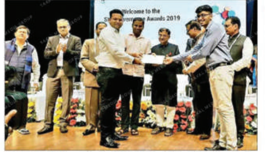
PROUD MOMENT: Computer Society of India giving 'Award of Recognition' to Pune city police for their project 'Third I - Enhancing Policing, Preventing Crimes through Digital Technologies'.

■ ST CORRESPONDENT reporters@sakaaltimes.com