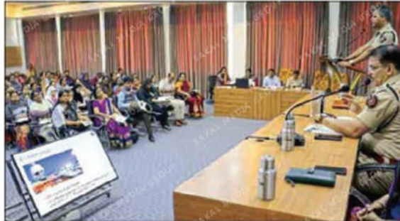
FOR BETTER TOMORROW: The Pune police held a workshop for the principals of 281 schools and colleges on various issues recently.

The cops educated the principals about various crimes including cyber cases, effects of drugs on children, good touch, bad