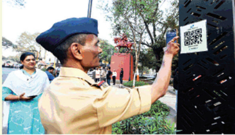
शहरात गस्तीवरील पोलिसांच्या हजेरीसाठी ठिकठिकाणी 'क्यूआर कोड' लावण्यात आले आहेत.

कोड 'स्कॅन' करून त्यांची उपस्थिती नोंदवत आहेत. सध्या शहरात वाहतूक शाखेकडून ४४९, दामिनी पथकाकडून ४७० आणि पोलिस ठाण्याकडून दोन हजार ९६२ अशा एकूण तीन हजार ८८१ ठिकाणी 'क्यूआर कोड' बसविण्यात आले आहेत. दामिनी पथकाच्या मार्शलनी