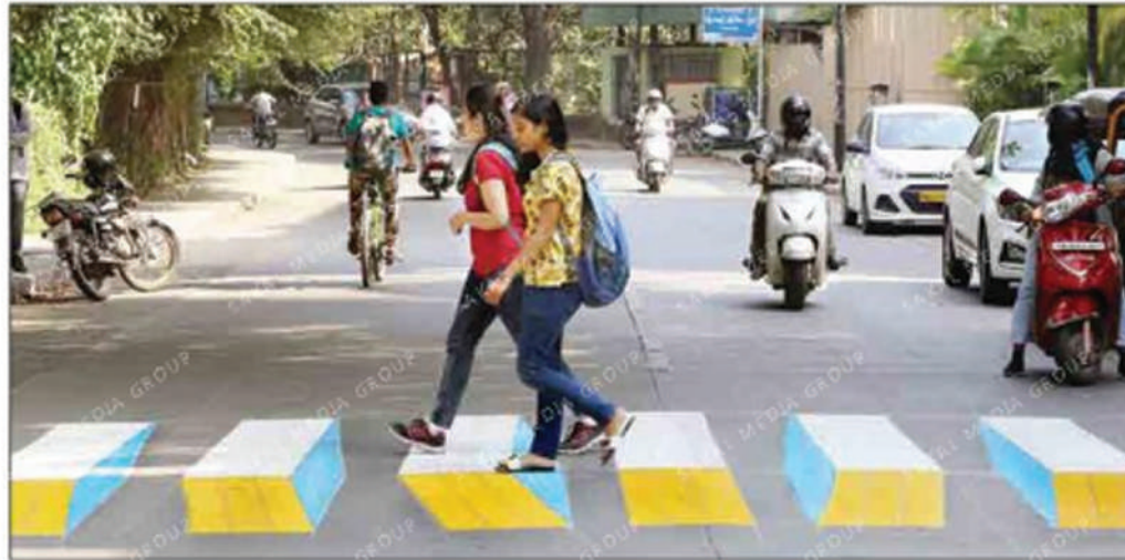
ONE OF A KIND: A file photo of 3D Zebra crossing in the city.

According to the PMC Road Department, the 3D